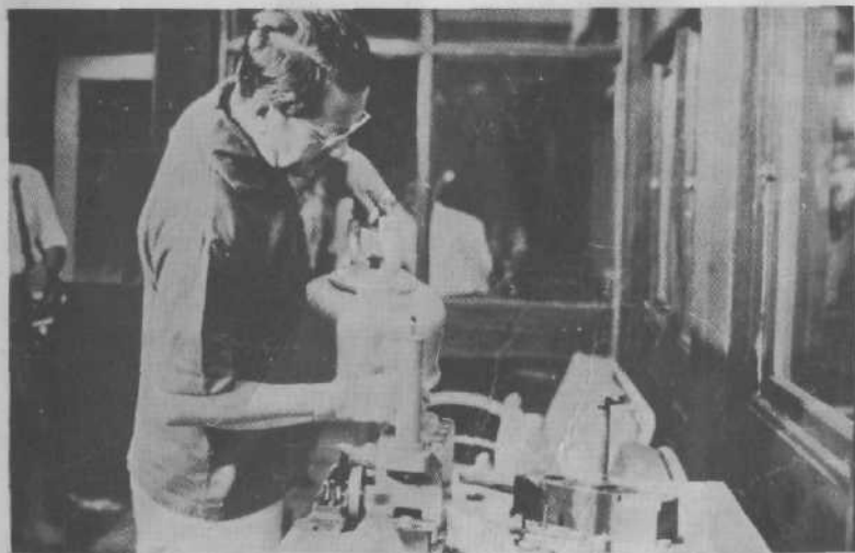
Dato' Seri Dr. Mahathir sedang sibuk di bengkel pertukangannya.

Tidak ramai yang tahu bahawa jari-jari tangannya adalah jari-jari yang mempunyai kesenian. Dr. Mahathir begitu berhasrat untuk dapat menggunakan jari-jarinya. Itulah sebabnya pada hari ini di samping menjadi Perdana Menteri, beliau mempunyai bengkel pertukangan tangannya sendiri di kediaman beliau. Beliau mampu membuat kaki lilin, lampu meja, rubber stamp, tempat abu rokok dan bermacam-macam lagi alat-alat handicraft do it yourself .