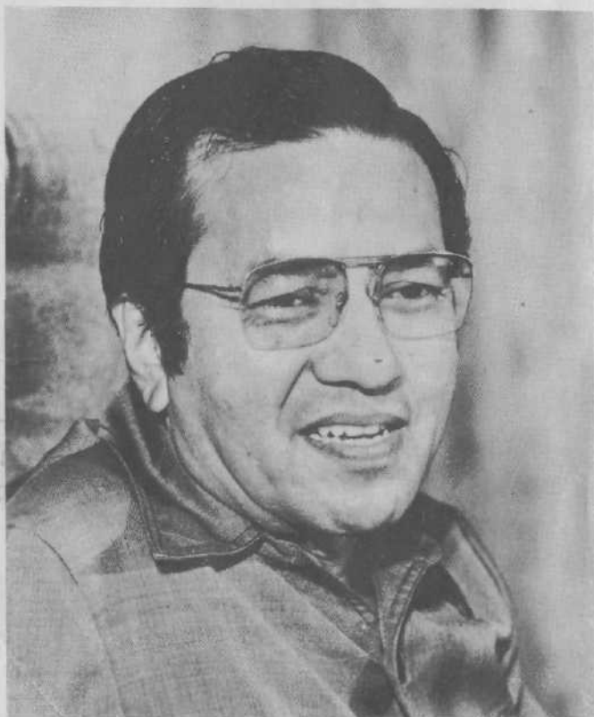
Dato' Seri Dr. Mahathir, gambar sebaik sahaja beliau diumumkan sebagai Perdana Menteri Malaysia Keempat.