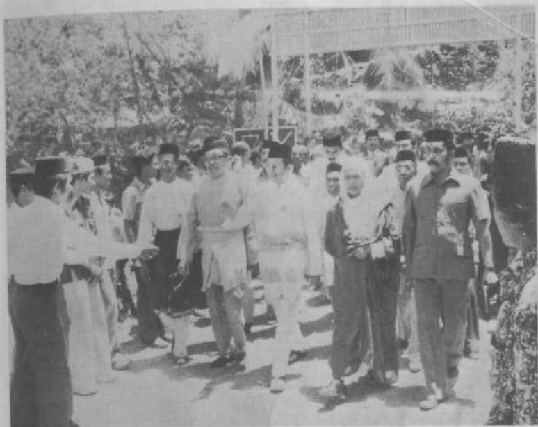
Sebagai ketua Kerajaan, Dato' Seri Dr. Mahathir memang sentiasa sibuk menjalankan tugas rasmi. Kelihatan beliau tiba di upacara pembukaan rasmi khemah kerja Belia Islam di Port Dickson.

Sebenarnya pendedahan beliau di dunia antarabangsa, telah bermula lebih awal dari ini. Pada tahun 1964, Dr. Mahathir telah dipilih sebagai Pengerusi Jawatankuasa Setiakawan Afro Asia bagi Malaysia, dan pada tahun 1965 beliau telah bersama-sama menyertai perwakilan Malaysia ke Bangsa-Bangsa Bersatu. Beliau juga mempunyai kesempatan menyertai Seminar Hal Ehwal Antarabangsa di Universiti Harvard, Amerika Syarikat di dalam tahun 1967.