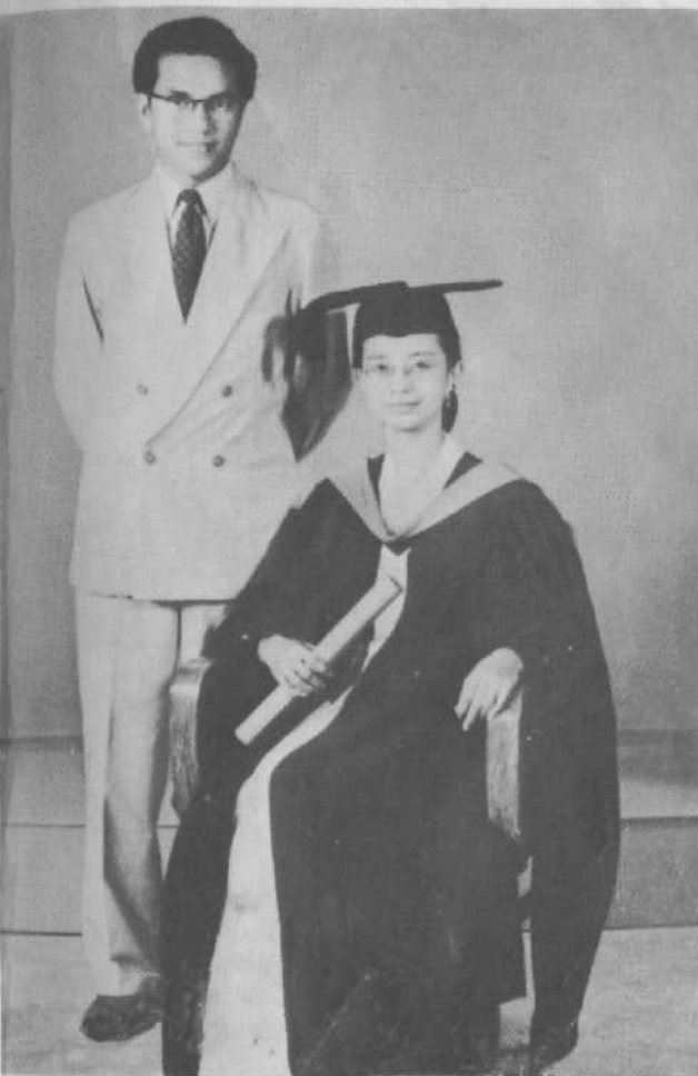
Bergambar kenangan sempena penganugerahan Ijazah Kedoktoran bagi Datin Seri Dr. Siti Hasmah.