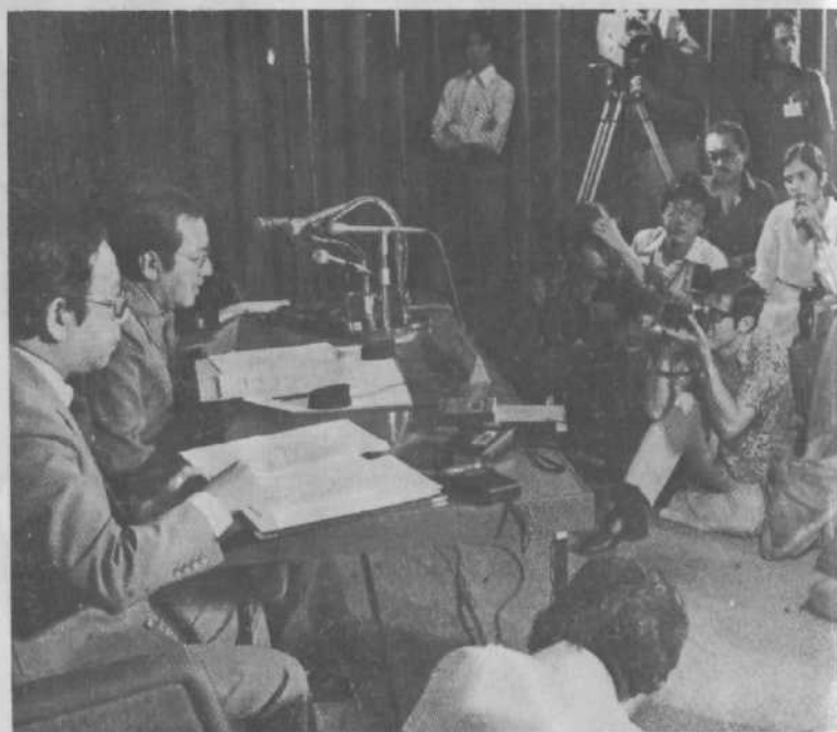
Dato' Seri Dr. Mahathir di sidang akhbar mengistiharkan kabinet pertama beliau.

Di dalam persidangan Ketua-Ketua Negara Islam di Taif pada bulan Januari, 1981, beliau telah diberikan penghormatan untuk mewakili YAB Perdana Menteri ketika itu.