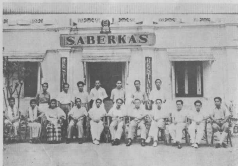
Di antara pertubuhan awal yang disertai oleh Dato' Seri Dr. Mahathir ialah SABERKAS. Dato' Seri duduk no. 3 dari kanan.

Sejak tahun 1945 lagi Mahathir bergiat cergas di dalam kesatuan Pemuda Melayu Kedah, Kesatuan Melayu Kedah, SABERKAS dan akhirnya UMNO. Beliau telah menghadiri sebagai pemerhati di Kongres Pertubuhan-Pertubuhan Melayu yang mencadangkan penubuhan UMNO. Sewaktu beliau melanjutkan pelajarannya ke Singapura, bumi dan udara Singapura sedikit pun tidak mengubah semangat yang telah tertanam itu. Semasa di kampus universiti, beliau terus cergas melalui beberapa persatuan pelajar di mana beliau memegang jawatan sebagai Presiden Pertubuhan Pelajar Islam.