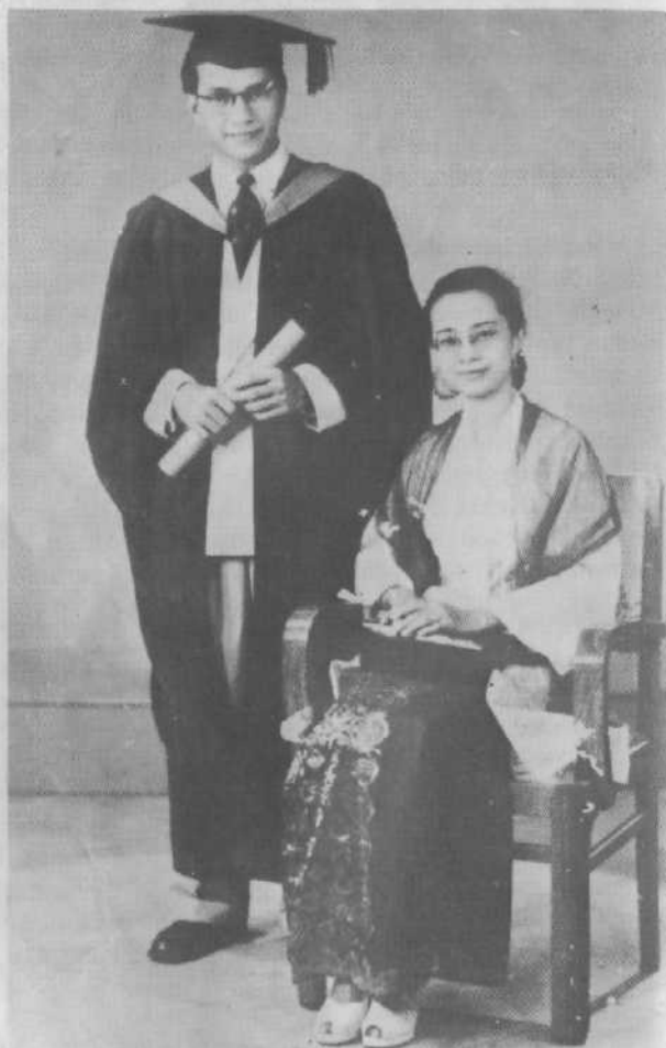
Hari yang paling mengembirakan hidup Dato' Seri Dr. Mahatma bila beliau dianugerahkan Ijazah Kedoktoran dari Universiti Malaya Singapura. Gambar kenangan bersama isteri tersayang, Datin Seri Dr. Siti Hasmah.