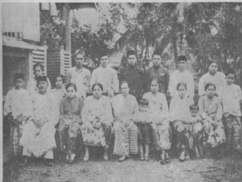
Bergambar kenangan bersama keluarga ketika masih kanak-kanak. Dato' Seri Dr. Mahathir berdiri di kanan bapanya.

Mahathir mula diperkenalkan kepada dunia persekolahan di Sekolah Melayu Seberang Perak. Beliau kemudiannya meneruskan pelajaran di Maktab Sultan Abdul Hamid, Alor Star. Dalam masa peperangan Jepun, Mahathir telah menggunakan masa yang ada padanya, dengan berniaga. Pada mulanya menjual cendul, diikuti dengan membuka kedai kopi dan kemudiannya membuka gerai buah-buahan di Pekan Rabu, Alor Star. Sifat-sifat amanah, jujur dan bersungguh-sungguh yang ada pada beliau telah dapat dilihat ketika itu lagi. Pada tahun 1945, beliau