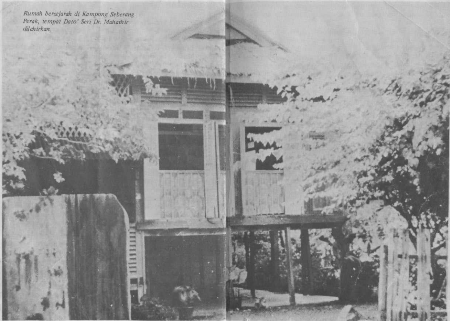
Rumah bersejarah di Kampong Seberang Perak, tempat Dato' Seri Dr. Mahathir dilahirkan.