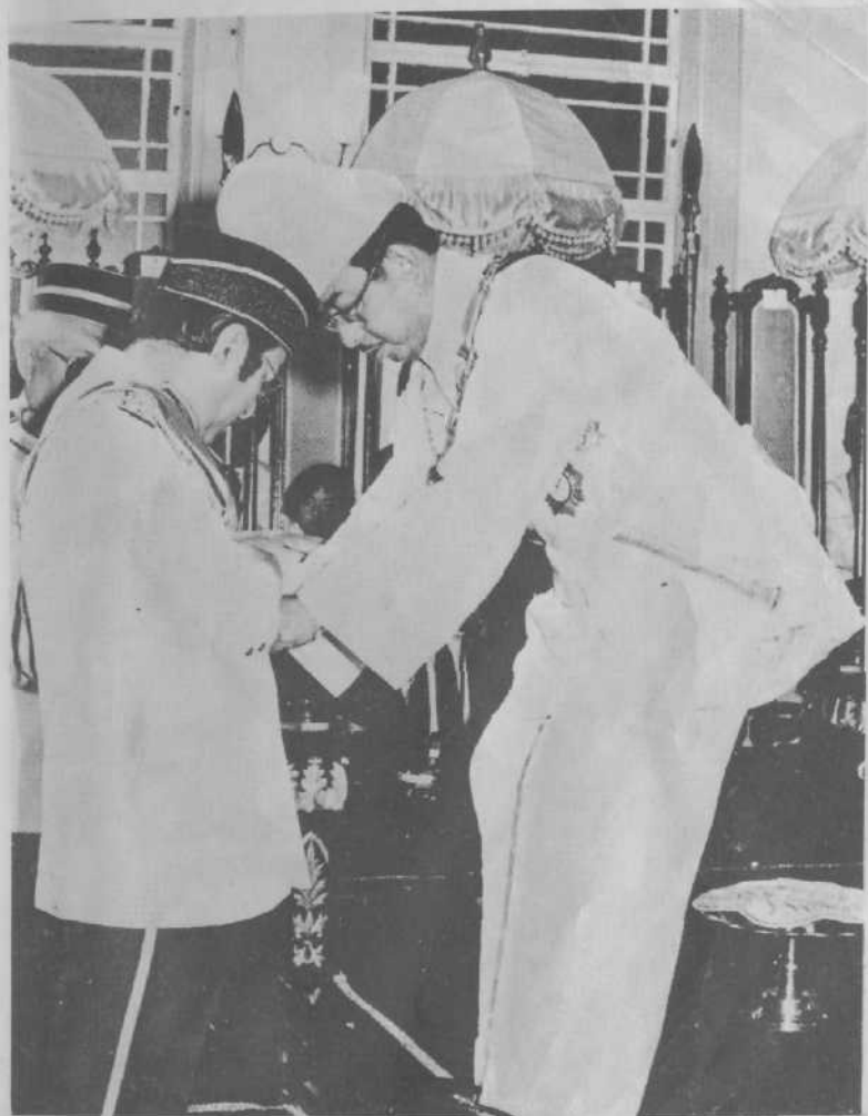
Dato' Seri Dr. Mahathir sedang menerima anugerah dari D.Y.M.M. Paduka Seri Sultan Perak, Darjah Seri Paduka Cura Si Manjakini (SPCM) yang membawa gelaran Dato' Seri.